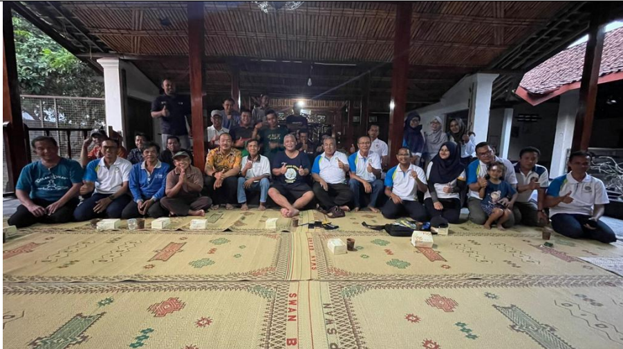
Gambar 1. Hari pertama kegiatan Pkm yang dihadiri oleh Bapak Rektor UNY