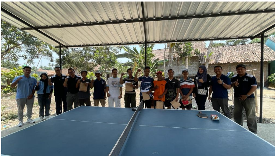
Gambar 2. Pelaksanaan PKm hari kedua